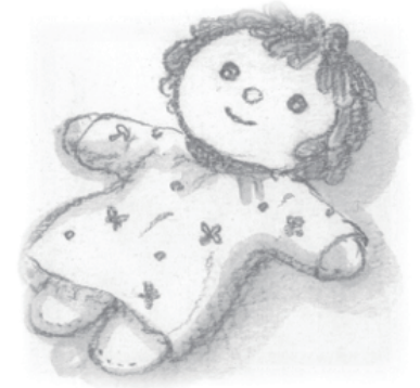
イラスト 田中せいこ